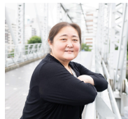
高山樹里氏 シドニー五輪銀・アテネ五輪銅メダリスト