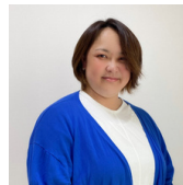
山田美葉氏 シドニー五輪銀メダリスト