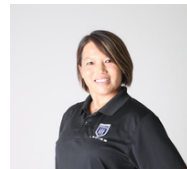
三科真澄氏 北京五輪金・アテネ五輪銅メダリスト